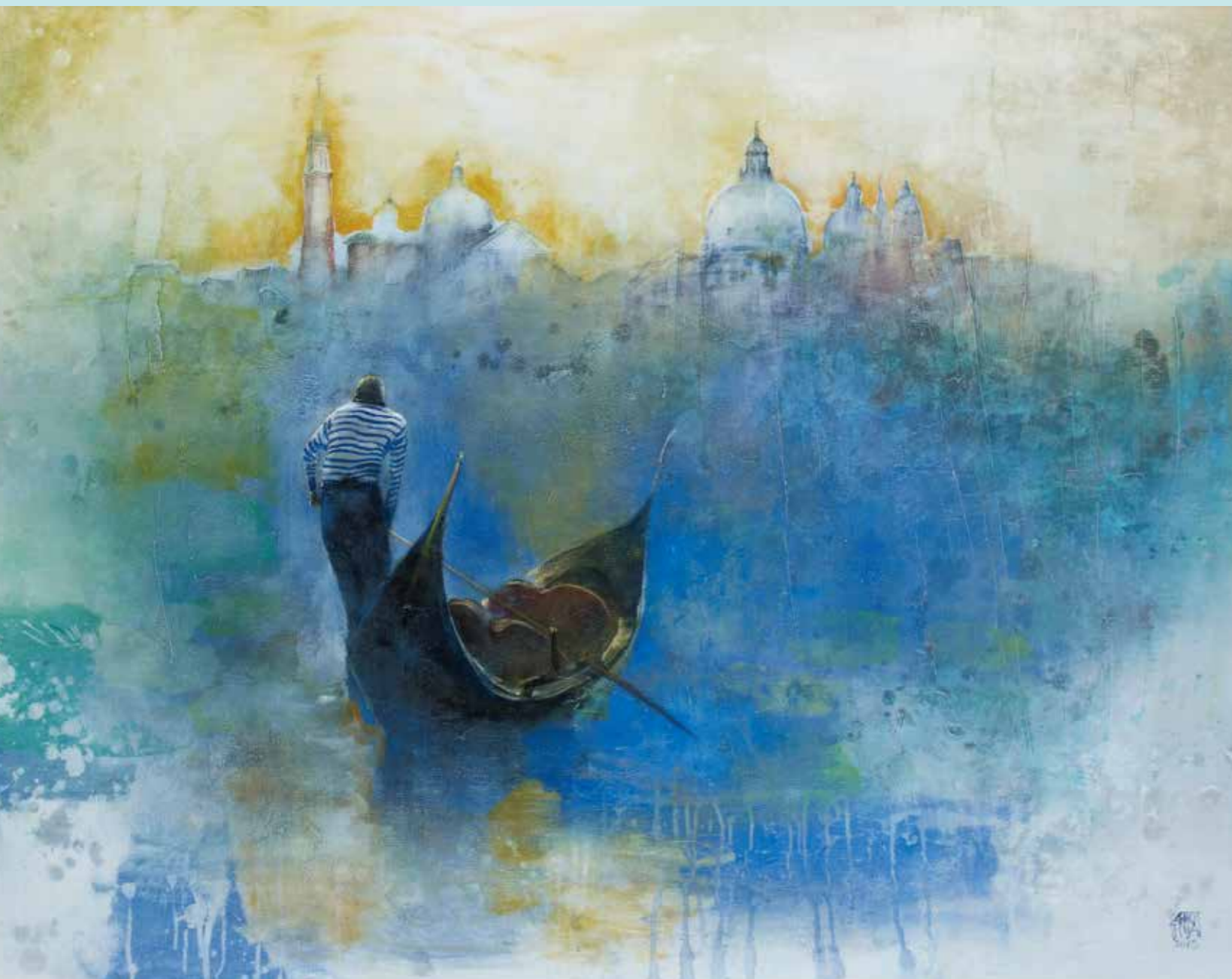
「ヴェニス 浪漫」蔡國華

ユーザーの声をフィルムに表現する クリロン化成株式会社 http://www.kurilon.co.jp/