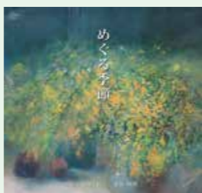
▲エッセイ画集「めぐる季節」